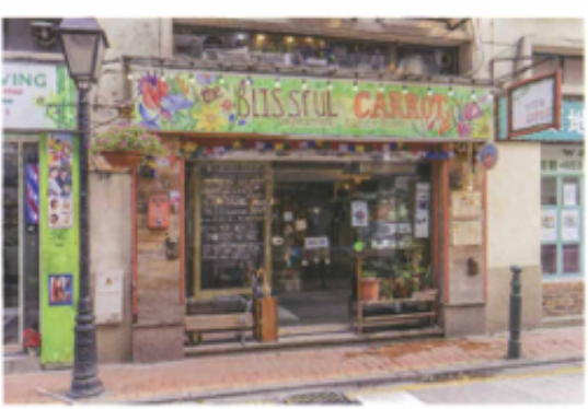
The Blissful Carrot 意食店