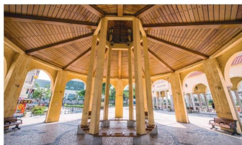
在旧城区，时常会遇见有趣的历史建筑，比如这个“旧排角”。